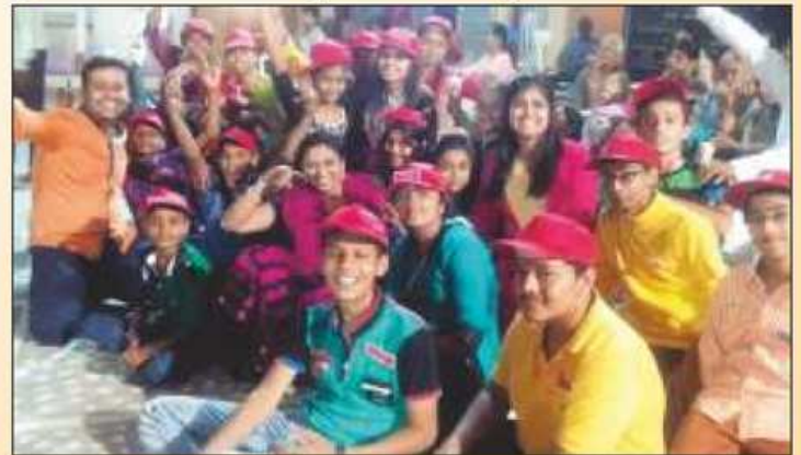
સાંચરાની બાળ-યુવા પેઢી પણ ધર્મ સંસ્કાર લેવા ઉત્સુક છે એ દર્શાવતી બાળ શિબીરની ઝલક