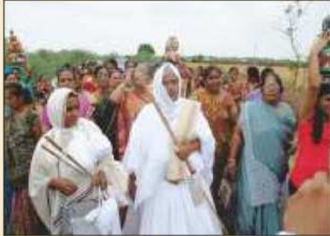
પૂજ્યશ્રીઓના પ્રવેશે આનંદ છવાયો